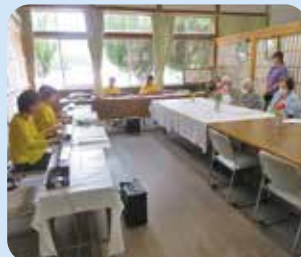
ゆすらうめの会との交流(6/24)