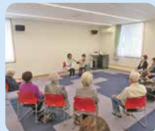
コミュニティ図書館見学(5/20)